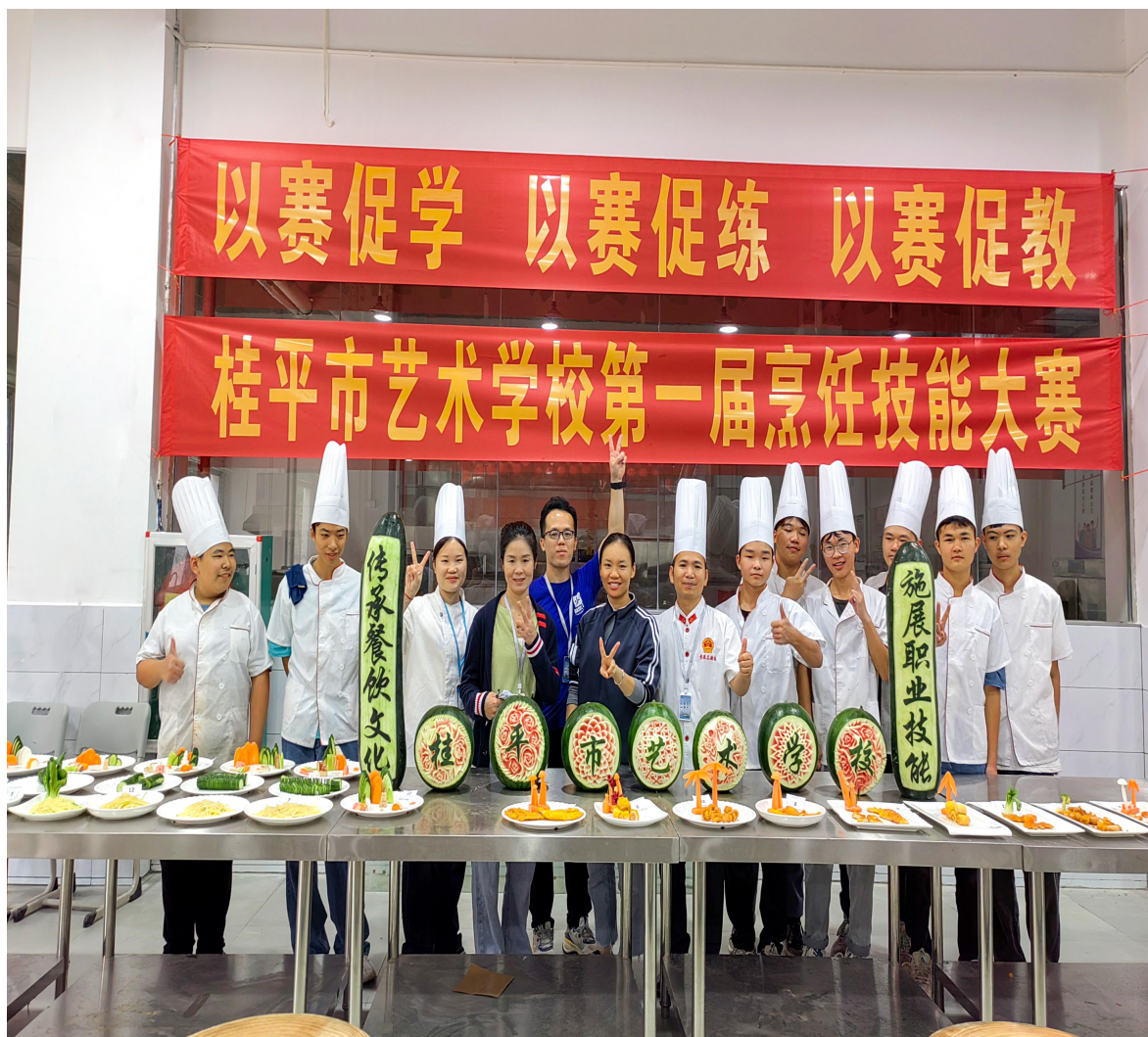
图 7 桂平市艺术学校举办第一节烹饪技能大赛

学生参加学校举办的 2023 年桂平市艺术学校中等职业学生技能大赛取得优异成绩。现代家政服务与管理专业 25 名学生参加烹饪技能比赛，2 人荣获一等奖；4 人荣获二等奖；6 人荣获三等奖；13 人荣获优胜奖。