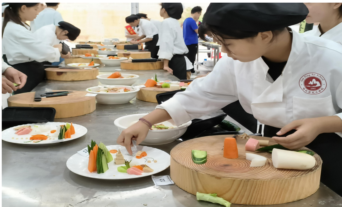
图 8 桂平市艺术学校举办第一节烹饪技能大赛