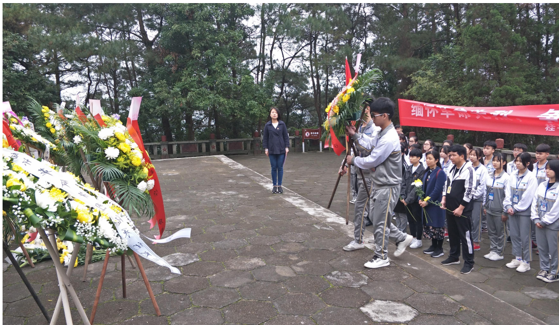
图 2 中共桂平市艺术学校联合支部委员会祭拜先烈活动

2.1.1 强化理论学习，创新学习方式，提升政治素养。坚持围绕中心、服务大局，聚焦重点亮点，加强正面宣传，唱响主旋律，弘扬正能量，传递“好声音”。