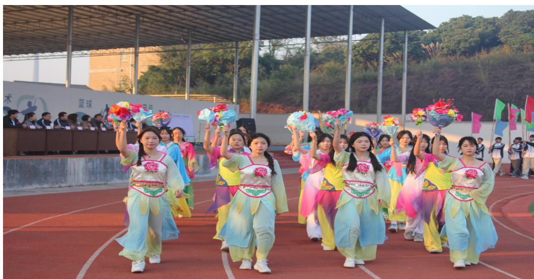
图 4 学校举办学校 26 届运动会丰富学生的在校生活