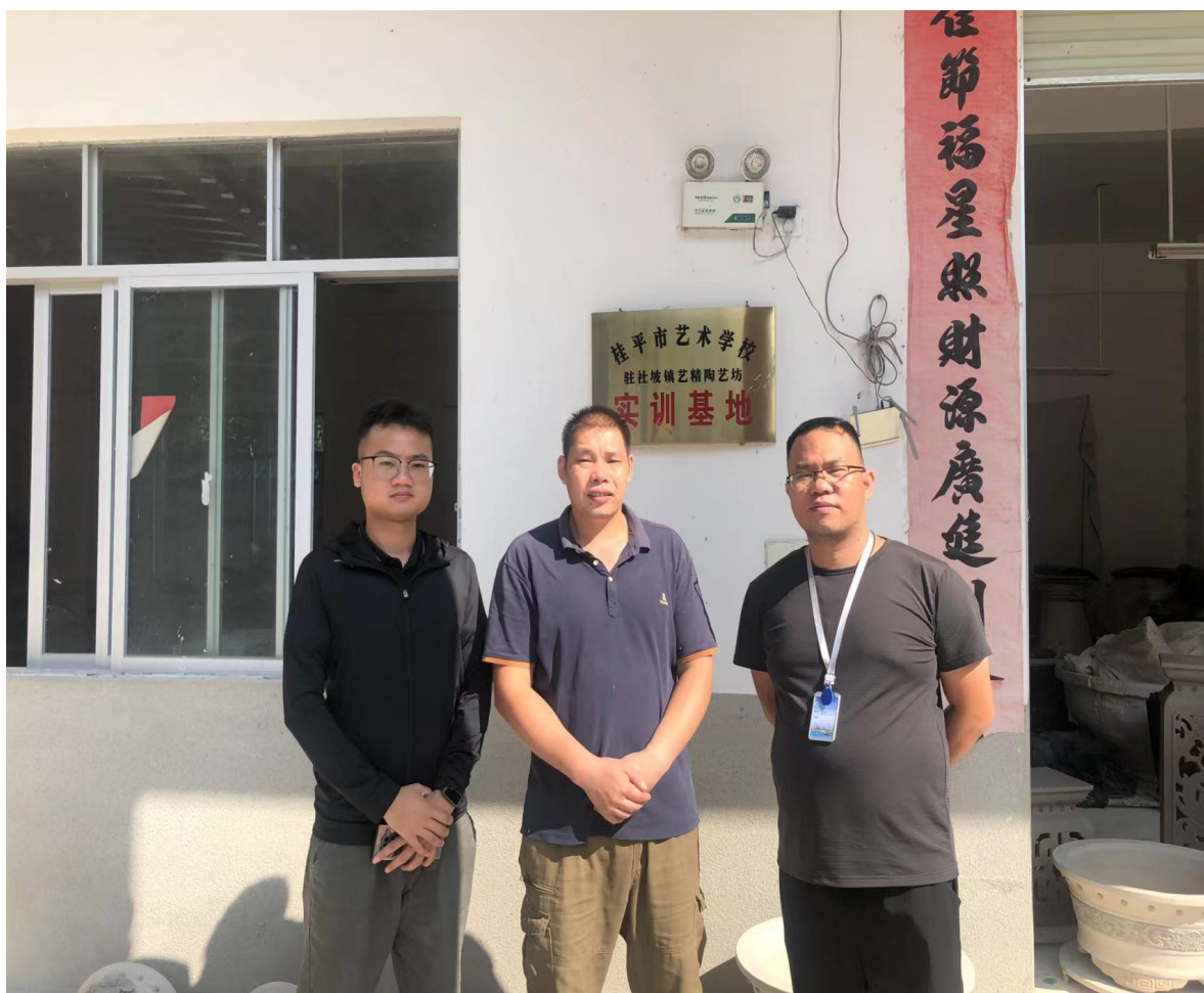
图 5 学校派遣教师到桂平市社坡镇艺精陶瓷坊进行企业调研

2.4.1 学校按要求开展各种形式的就业指导活动，扎扎实实开展就业指导工作。邀请区内外优质企业行业专家到校开展就业指导讲座，实施“走出去，请进来”的就业原则，今学年分批派出将近 20 多人次到区内外对企业进行考察、调研，全方位了解企业的用工需求。不定期地进行跟踪调查回访，了解学生实习、就业情况。学校通过问卷调查方式对 10 家用人单位进行调查，用人单位对学校实习、就业学生的满意度为 100%。