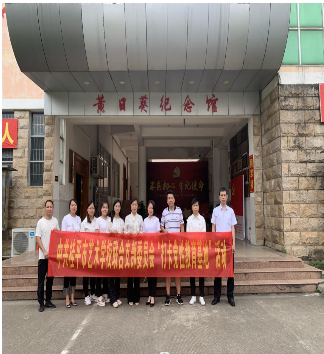
图 1 中共桂平市艺术学校联合支部委员会参观黄日葵纪念馆

组织党员到烈士纪念碑、黄日葵烈士纪念馆等开展活动，重温入党誓词，学红色党史，更好地教育引导党员传承红色基因。