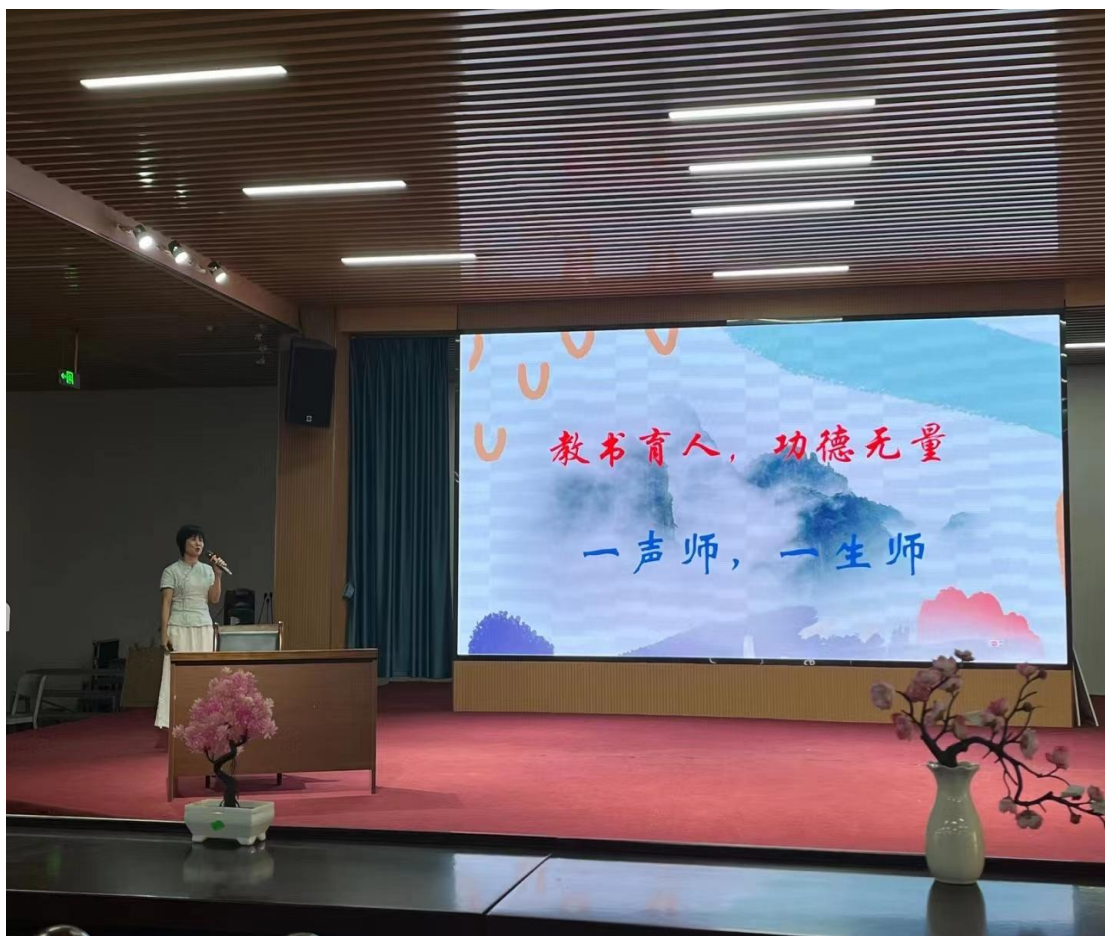
图 9 桂平市艺术学校开展师德师风培训工作

住各级各类学习的机会，提升各方面的能力，特别是教师刻苦专研课题和课程，转变教育教学理念，调整教学思路，提高教学效果。2023 年 7 月，学校绘画专业教师到广州进行绘画专业技能进修；不断提高专业教师的专业技能。