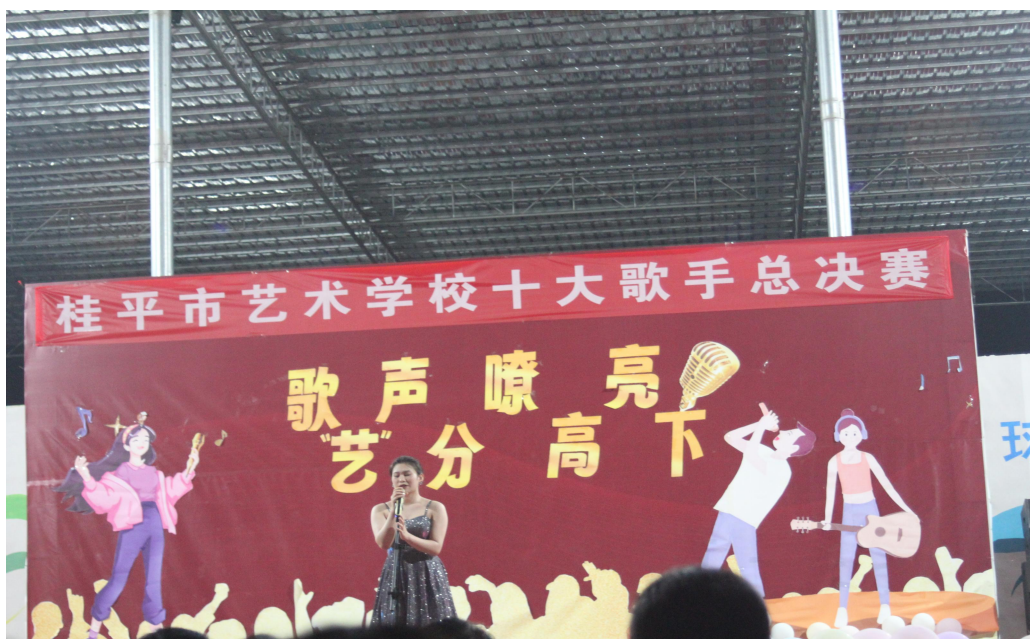
图 3 学校举办校园十大歌手比赛丰富校园文化生活

鲜明的校园文化。以正确的校园文化指引学校的教与学，增强学校质量生成的主动性与自觉性，并使之成为学校发展常态化动力机制中强有力的“文化引擎”，从而激发学生的学习兴趣、增强学生对职业教育的认同感、丰富学生在校学习生活体验。