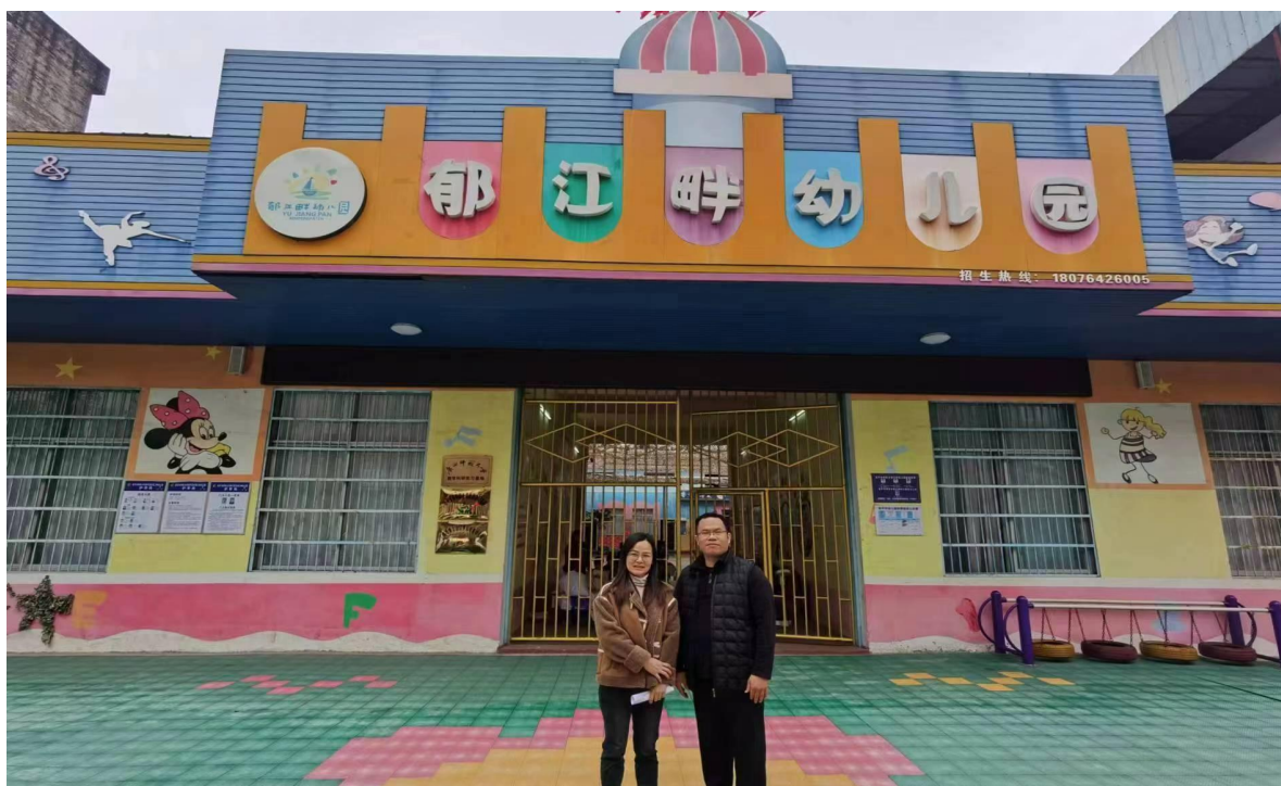
图 6 学校派遣教师到桂平市郁江畔幼儿园进行校企合作考察

2.4.2 2023 年我校中等职业绘画专业毕业生共计 493 人，就业（含升学）学生人数 447 人，其中直接就业人数 271 人，升入高一级学校人数 176 人，未就业人数 46 人，就业率 90.7%，现将学校 2023 年毕业生就业具体情况分析如下：